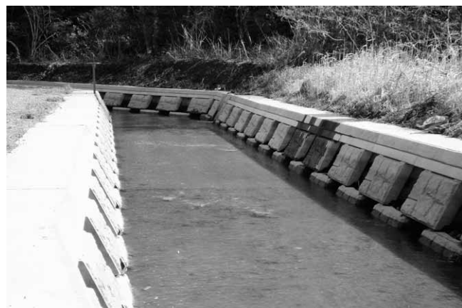
農村総合整備事業／両竹地区