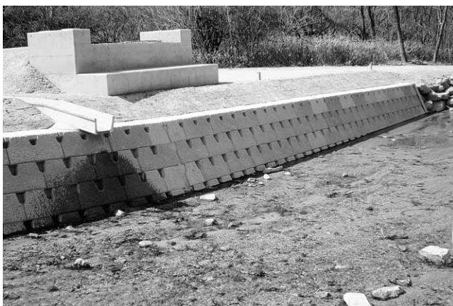
中山間地域総合整備（一般型）／津島地区