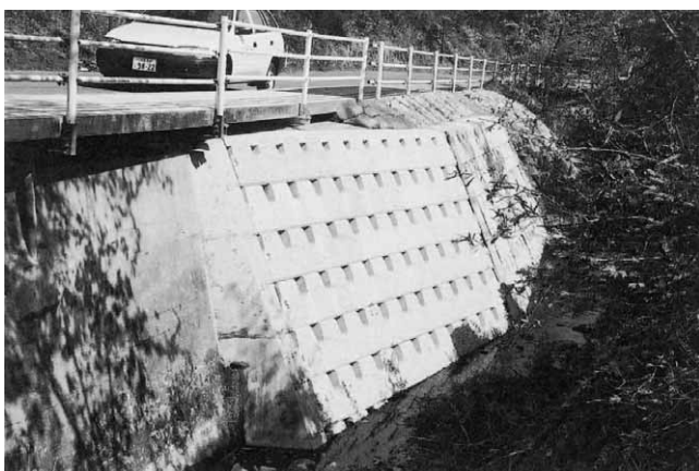
道路災害復旧工事／小埴上郡山線